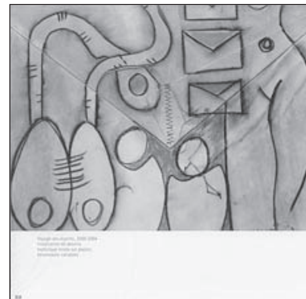
Un total di 13 artista a expone su obra den e Centro Cultural "de Rencontre Fonds Saint Jacques". Riba e combinacion di potret aki nos por haya un bista di e obranan cu a participa den e exposicion aki na Martinique.

area di e Caribe Frances. El a haya chens di comparti cu artistanan di Arte Contemporaneo, mayoria di nan di Martinique, Barbados, Republica Dominicana y Cuba. Den seno di e expo aki ta-